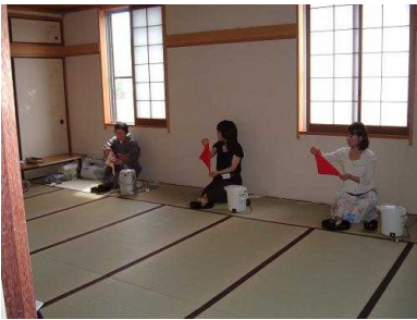
お茶を愉しむ会(21日)