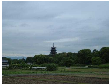
レッツウォーク津高(27日) 吉備路を歩きました