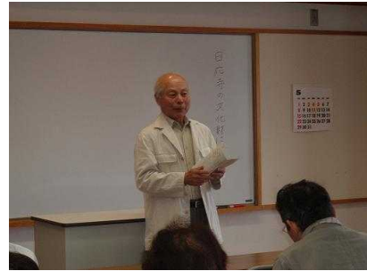
ふるさと歴史探訪 ~日応寺の文化財について (23日)